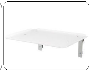
Bandeja para Monitor