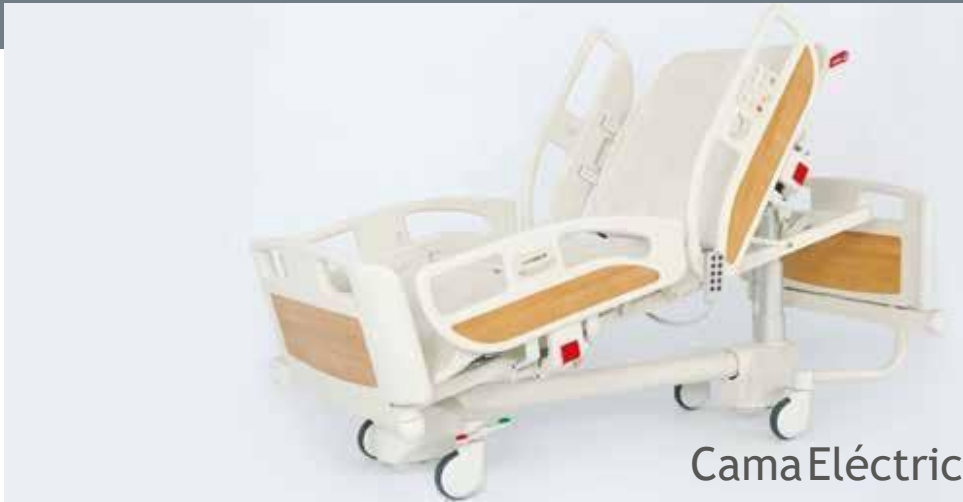
Cama Eléctrica Básica